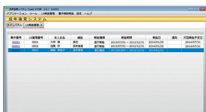
< LS 報告管理画面 >

「LS報告管理」画面ではLSシステムに報告を行う案件を一覧上で管理することができます。一覧では各案件の報告データの作成状況や次回の報告予定日を確認することができます。報告期間をあらかじめ設定しておくことにより報告の予告通知を行うアラート機能も装備しています。また、案件内ではLSシステムへの報告データと添付書類を一緒に保管することができますので、報告をする際も簡単に添付書類を見つけることができます。