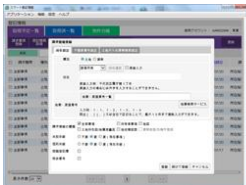
(請求情報事前登録画面)